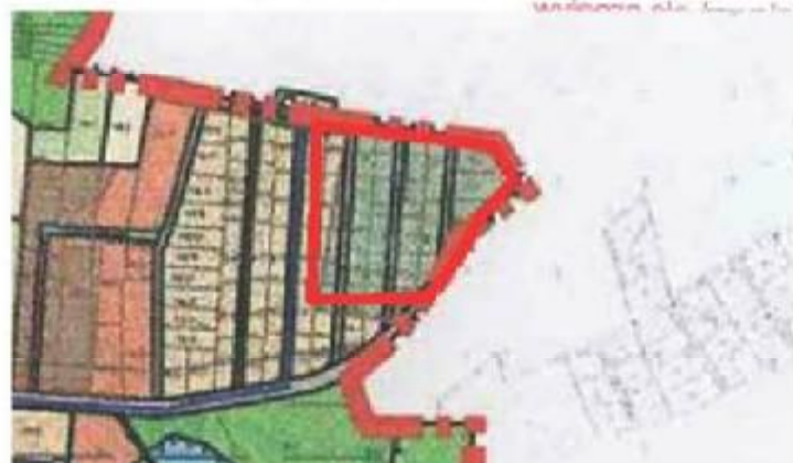
WYRYS ZE STUDIUM UWARUNKOWAŃ I KIERUNKÓW ZAGOSPODAROWANIA PRZESTRZENNEGO GMINY PORAJ W SOŁECTWIE ŻARKI LETNISKO SKALA 1 : 10 000