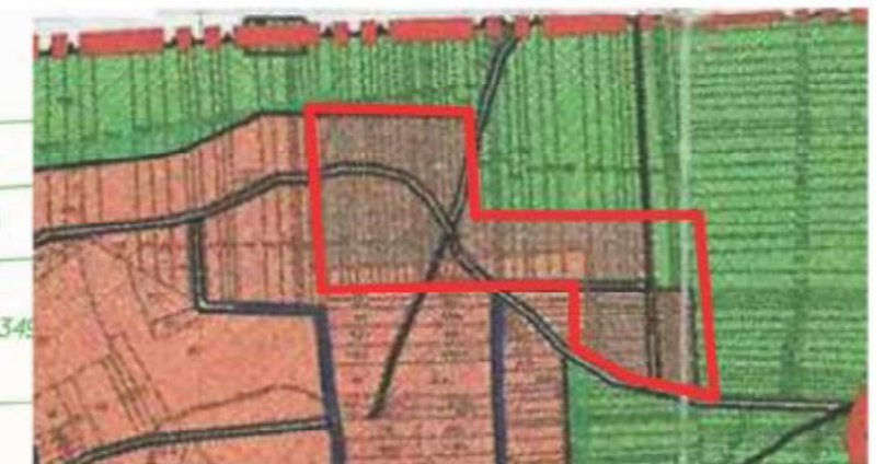
WYRYS ZE STUDIUM UWARUNKOWAŃ I KIERUNKÓW ZAGOSPODAROWANIA PRZESTRZENNEGO GMINY PORAJ