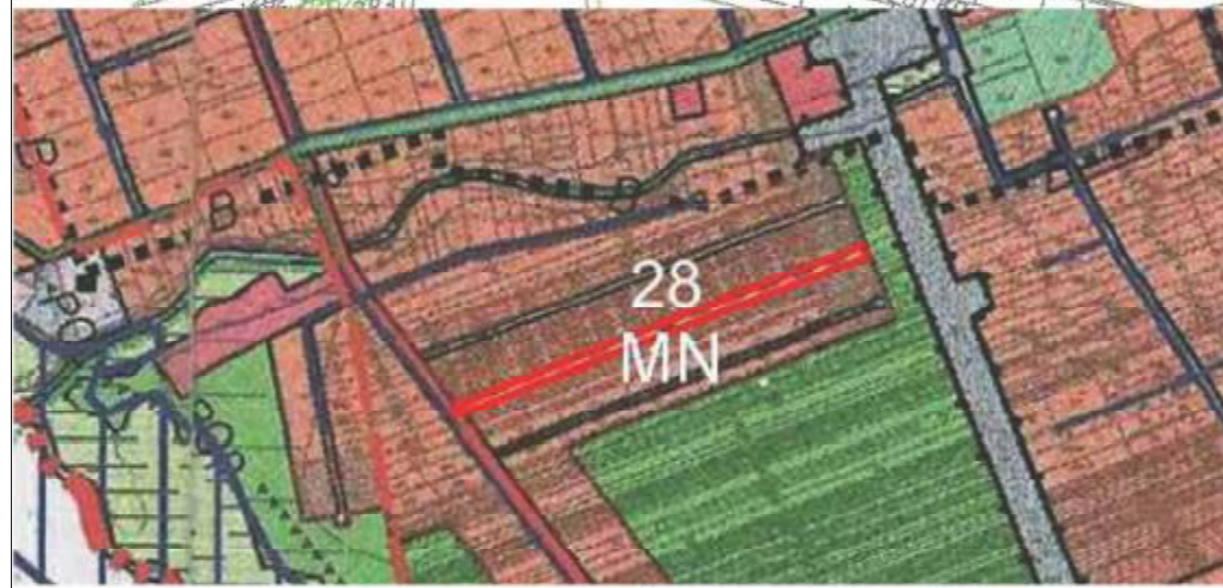
WYRYS ZE STUDIUM UWARUNKOWAŃ I KIERUNKÓW ZAGOSPODAROWANIA PRZESTRZENNEGO GMINY PORAJ