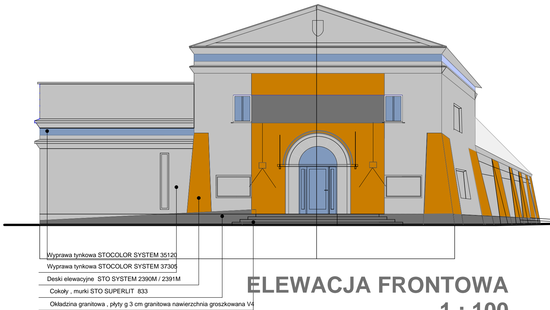
ELEWACJA FRONTOWA 1 : 100